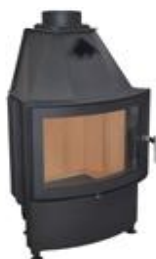
MYTO R550, LD